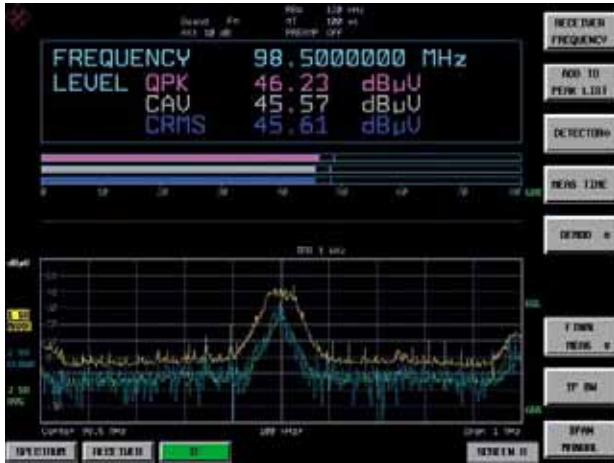
接收机模式（频率/电平显示、条形图显示和设定中心频率的连续实时IF分析）