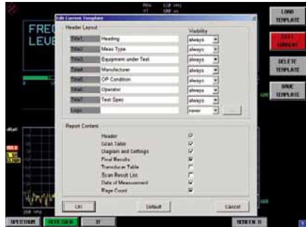
报表生成器的模板编辑器